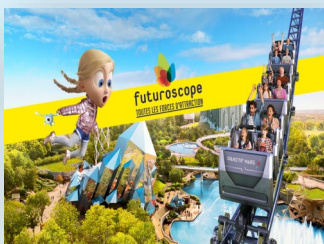
1 journée au Futuroscope