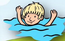
Un après-midi à la piscine de Mortagne sur Sèvre