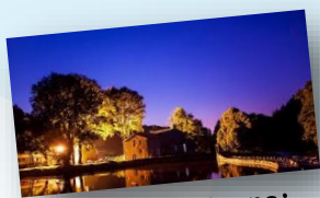
Veillée nocturne : entre chien et loup

Bivouac pour les enfants de 6 à 12 ans nés entre 2010 et 2015