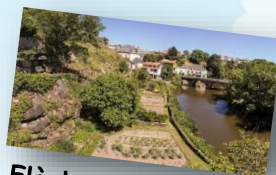
Flèches Polynésiennes Rallye découverte