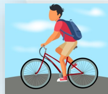
Animations autour du vélo